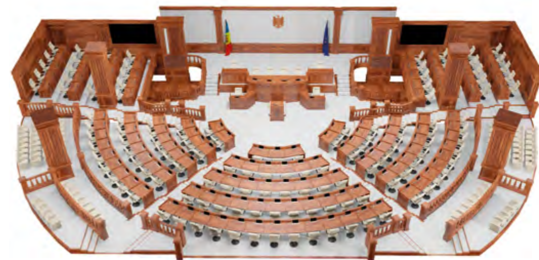
3D-модель зала пленарных заседаний. Автор – Мирча Зубку

Это самый большой зал в здании, разделённый на зону для 101 депутата Парламента Республики Молдова и зону для приглашённых, в том числе из Правительства, Секретариата Парламента, подведомственных Парламенту учреждений, дипломатического корпуса, для посетителей и представителей средств массовой информации. С 2021 года