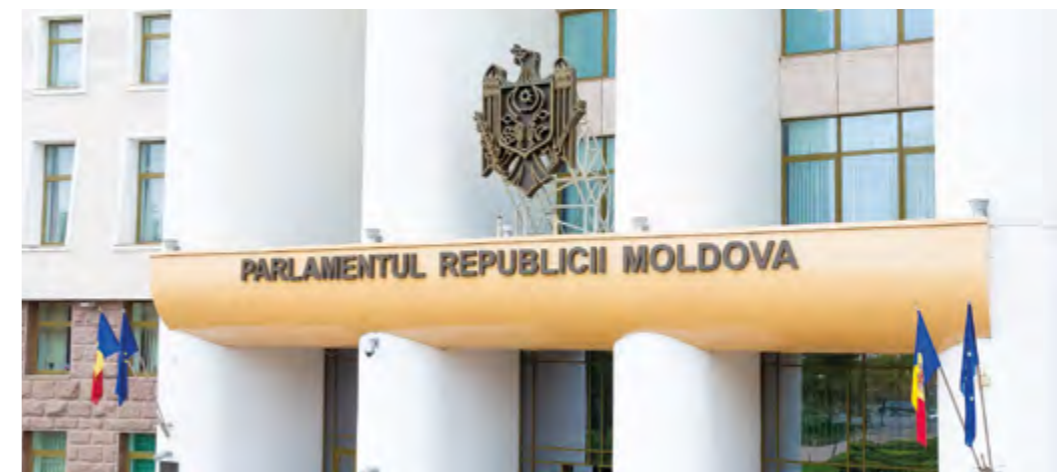
Фасад здания Парламента Республики Молдова в настоящее время

Все работы были согласованы с автором герба Георге Врабие, скончавшимся в марте 2016 года.