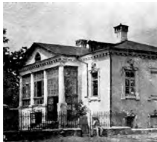
Дом губернатора Константина Катакази, конец XIX века.

До межвоенного периода на месте, где находится здание Парламента, располагались частные одноэтажные дома, в которых проживала городская знать. Историки утверждают, что в этом районе находился дом губернатора Константина Катакази, управлявшего Бессарабией в 1817–1825 годах. Он принадлежал к аристократической русской семье греко-фанариотского происхождения, имевшей большие владения в восточной Молдове, и был женат на княгине Екатерине, дочери Константина Ипсиланти.