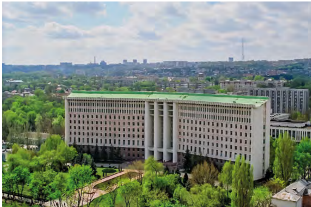
Фасад здания Парламента Республики Молдова, 90-е гг.

Позднее согласно части (2) статьи 60 Конституции Республики Молдова, принятой 29 июля 1994 года, число мандатов Парламента было сокращено до 101.