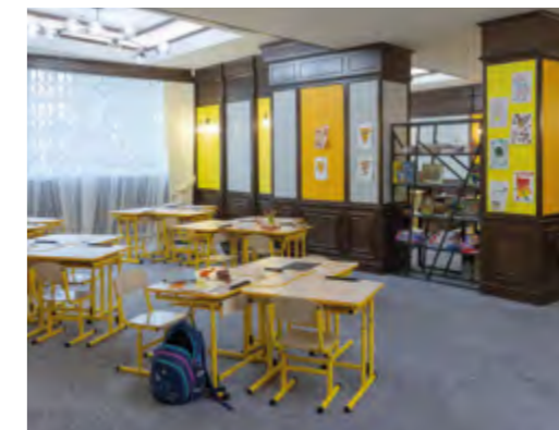
Слева направо: Герб в президиуме зала пленарных заседаний, корпус G и детская комната сегодня