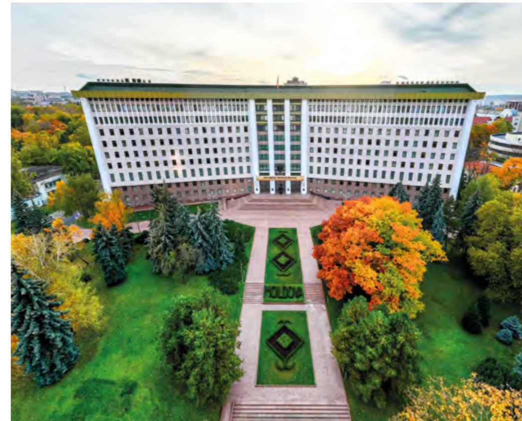
Сквер перед зданием Парламента, 2024 г.

В 2014 году во время саммита спикеров парламентов стран Балтии и Северной Европы и соответственно в 2022 году во время совместного официального визита спикеров парламентов стран Балтии и Северной Европы в память о событиях в сквере были высажены деревья туи.