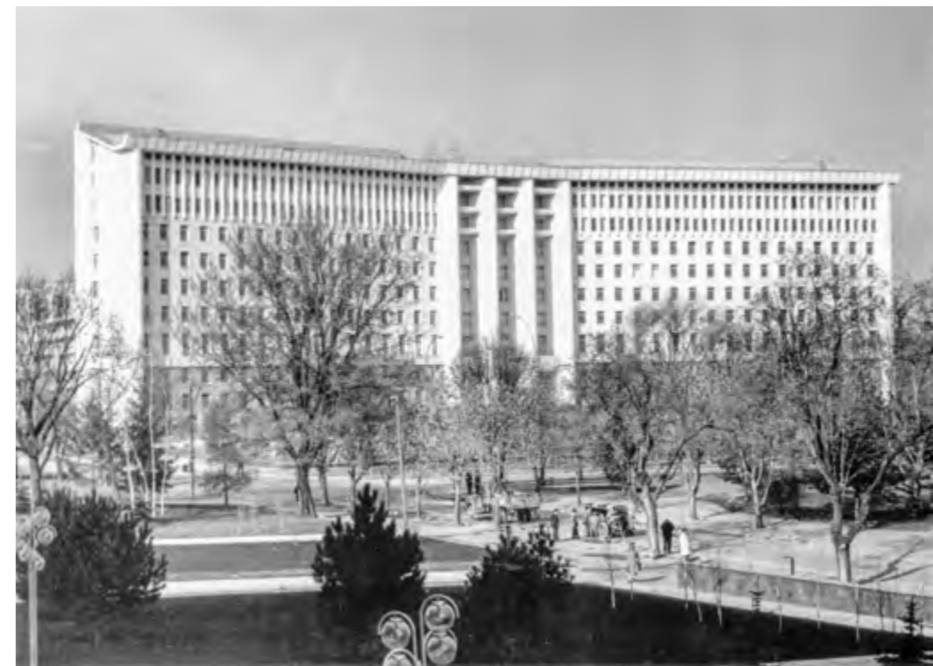
Фасад здания Центрального комитета Коммунистической партии МССР, 1976 г.

Нынешнее здание Парламента было построено в 1973–1976 годах по проекту архитекторов Александра Черданцева и Григория Босенко. Оно было спроектировано как административное здание Центрального комитета Коммунистической партии Молдавской Советской Социалистической Республики (МССР) и признано зданием национального значения. Ответственным за проектирование был Государственный институт проектирования в строительстве «Молдгипрострой».