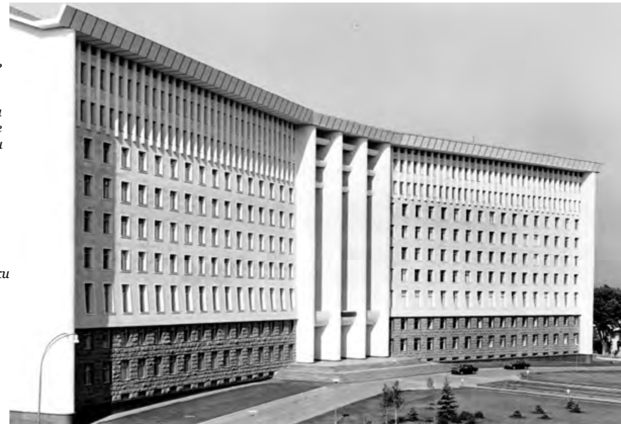
Фасад здания Центрального комитета Коммунистической партии МССР, 1976 г.

Поскольку сдачу в эксплуатацию удалось осуществить на день раньше, были выделены премии в размере 60690 рублей, что составляет эквивалент стоимости 10 автомобилей «Жигули» того периода.