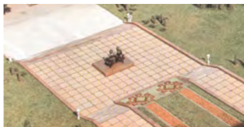
Внешний вид сквера перед зданием, 1976 г.

Руководители партии принимали активное участие в координации работ по проектированию и строительству объекта.