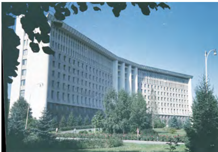
Общий вид здания Центрального комитета Коммунистической партии МССР, проспект Ленина (ныне Штефана чел Маре ши Сфынт), 1977 г.