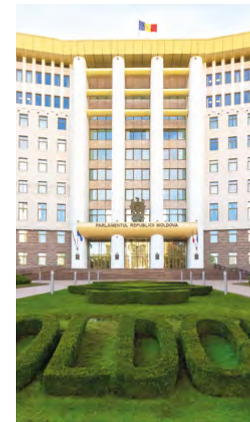
Главный вход в здание Парламента Республики Молдова, 2024 г.