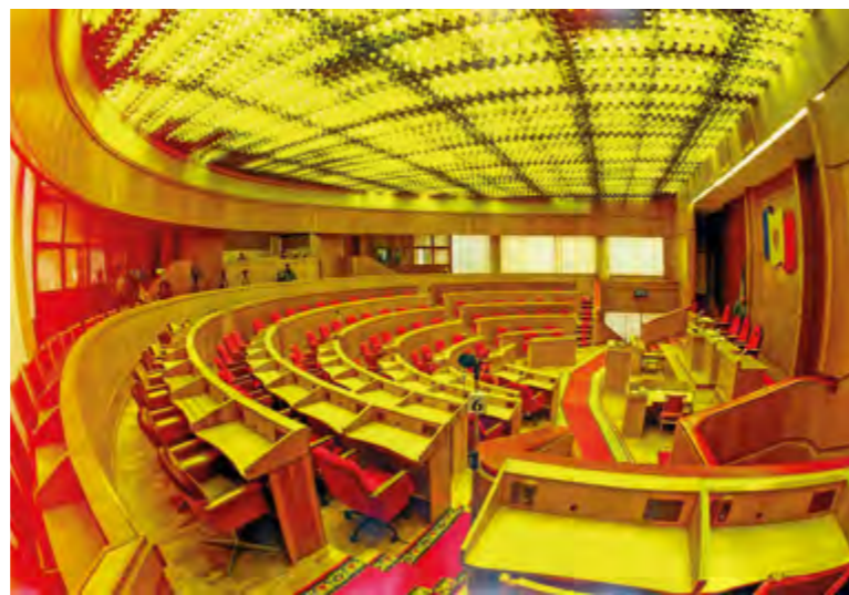
Внешний вид зала пленарных заседаний до 2009 г.

Здание Парламента Республики Молдова представляет собой монолитное сооружение из железобетона с фасадом, облицованным плитами из котельца и розового гранита, а цоколь – плитами из мрамора и красного гранита. Центральную часть фасада занимают четыре колонны на всю высоту самого здания. Информация о строительстве здания доступна общественности с 2010 года.